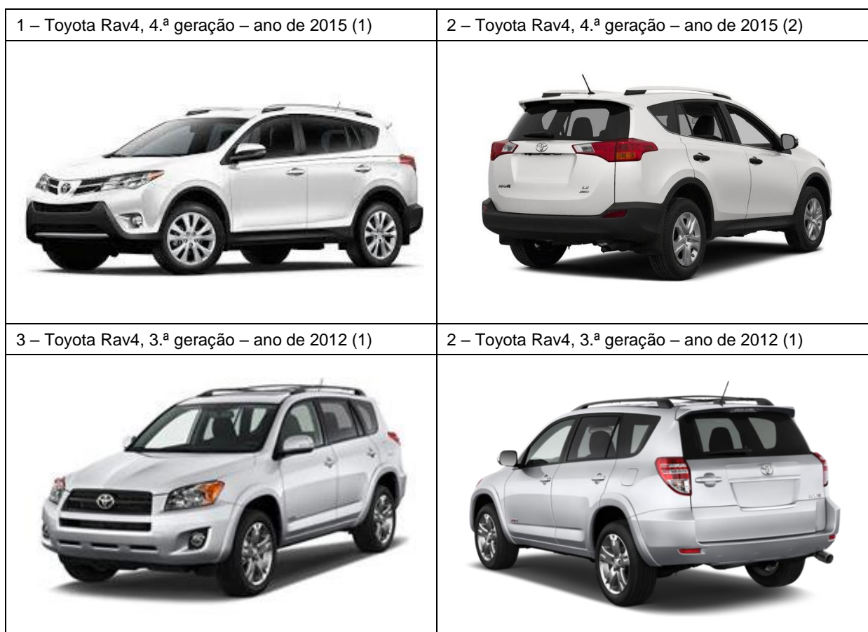
Figura 1 – TOYOTA RAV4 PREVISTO NO CONTRATO VS MODELO FORNECIDO E PAGO

Não foi facultado a este Tribunal o certificado do fabricante relativo ao carro fornecido, documento que, de acordo com os termos do concurso realizado, deve integrar as propostas das empresas concorrentes.